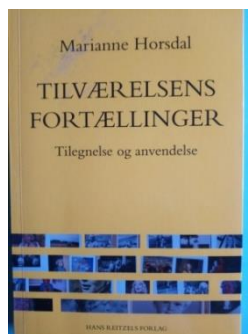
Tilværelsens fortællinger (2017).