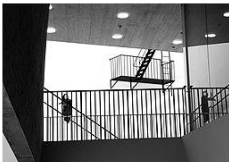
Israel 84655 the future 2014 elmgreen amp dragset