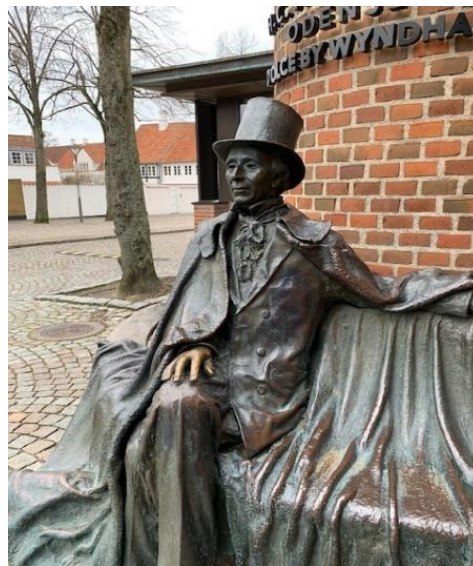
Jens Galschiøts bronzestøbninger v. H.C. Andersen hotellet.